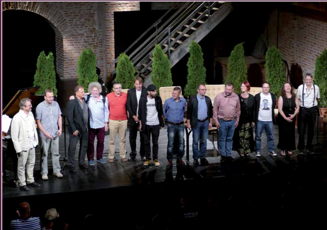
Bárka 2017/5. szeptember-október

„...nyitott, befogadóképz... minden érték iránt, tekintet nélkül a korra, nemre, származásra és lakhelyre, az uralkodó és a háttérbe szorított kánonokhoz, a különböző művészeti irányzatokhoz, csoportokhoz való tartozásra... tudatos kánontörés... irodalmi és művészeti vizeink keresztül-kasul hajózása... olyan termékeny eklektika..., amely a különböző szemlélet- és beszédmódok, formaelvek szerint létrejött alkotásokat szükségszerűen dialóguskényszerbe hozza, talán nem ellenére a szerzőknek sem, de mindenképpen az olvasók öröme... a regionalitás és az egyetemesség, a minőség- és értékelvű szemlélet- és gondolkodásmód keretei között...”