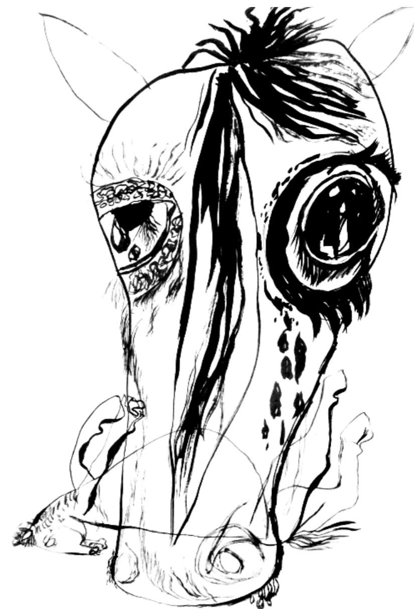
Lófej (1945; tus, papír; 310x220 mm; leltári szám: 2010.17.1.;)

E számunkat Hincz Gyula munkáival illusztráltuk. A műtárgyak a váci Madách Imre Művelődési Központ tulajdonát képezik. A borító 1. oldalán: Erdélyi táj / Tájkép hegyekkel (1942–1943; olaj, vászon; 109x134 cm; leltári szám: 2011.61.1.; fotó: Kertész Zoltán) A borító 2. oldalán: Lovas figura (1946; rézkarc, papír; 250x330 mm; leltári szám: H.244.1.;) A borító 4. oldalán: Olivér kérdése. Nyomásteru Anatole France Nyársforgató Jakab meséi című könyvéhez (1948; linóleum-metszet, papír; 55x70 mm; adattári szám: AD/38–2012;)